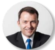
Jürg Lauber Schweizer Vertreter bei der UNO