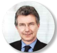
Christoph Heusgen Deutscher Vertreter bei der UNO